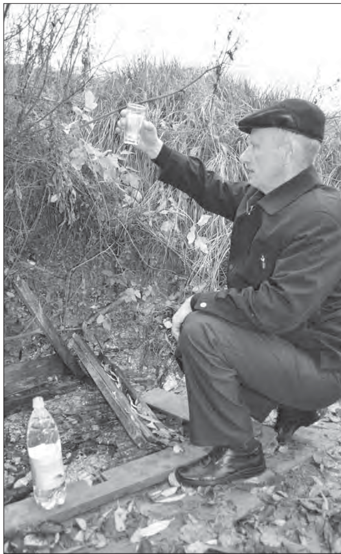
■ Так выглядел родник в Вerveковке год назад

Благоустройство двух родников стало возможным благодаря участию Твердохлебовского и Поповского поселений, на территории которых были активно используемые источники, в областной целевой программе «Возрождение родников Воронежской области». Устремления сельских администраций активно поддержали и жители этих поселений, и руководство района. Участие в программе состоялось: осенью этого года финансирование было получено, и деньги пущены в дело.