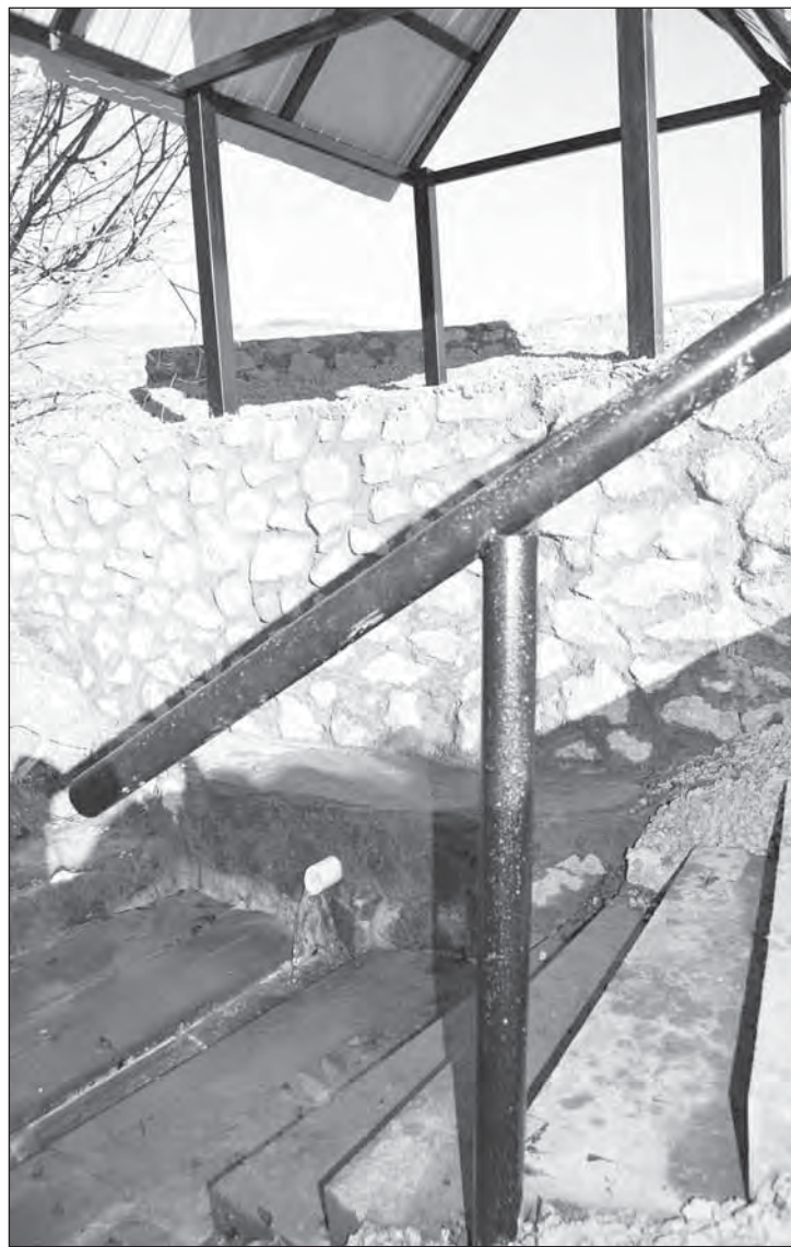
■ На обустройство родника в Вerveковке было потрачено 350 тыс. рублей