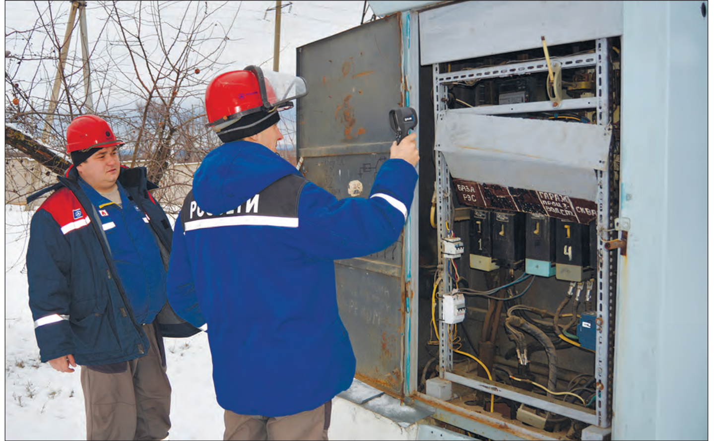
■ Несколько минут – и причина поломки установлена

В районных электросетях в настоящее время трудится 73 человека