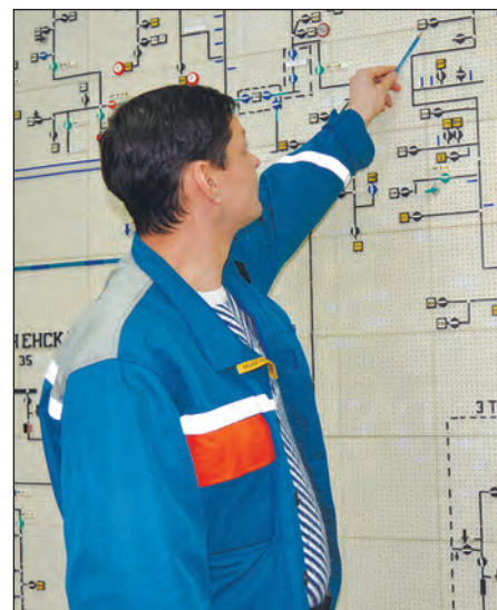
■ Вся сеть – как на ладони

Просторное помещение диспетчерской практически всё отдано под огромную мнемосхему. С её помощью диспетчеры «видят» все электросети района и