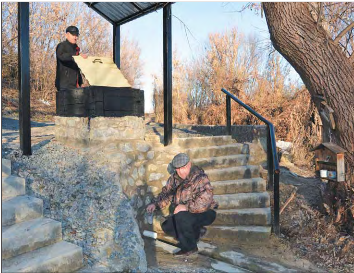
Обновленный твердохлебовский родник вполне может стать местом отдыха сельян

Для сохранения родников в Вerveковке и Твердохлебовке из областного бюджета выделено 700 тыс. рублей