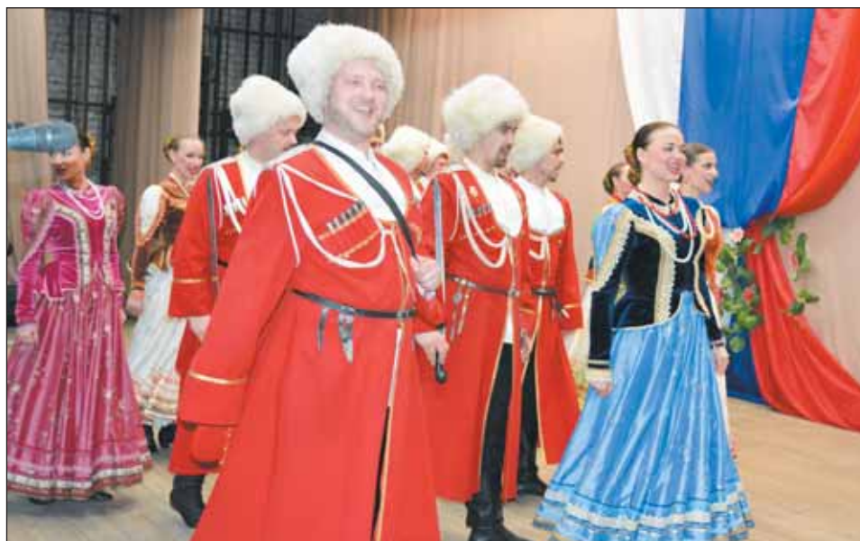
Выступление казачьего ансамбля «Криница» было настолько захватывающим, что люди в зале пустились в пляс