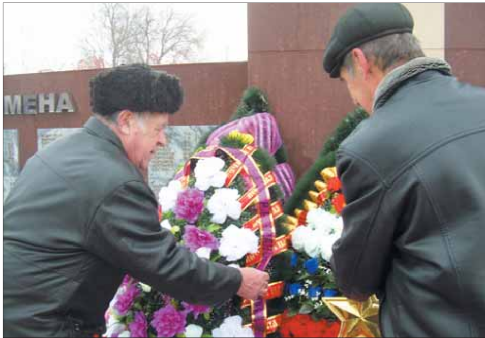
Возложение венков к мемориалу в городском парке